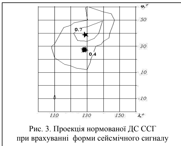
Рис. 3. Проекція нормованої ДС ССГ при врахуванні форми сейсмічного сигналу

На рис. 3 наведено проекцію ДС ССГ за рівнем кореляції (4) для ПнКВП. Аналіз наведеної залежності показує, що перехід до використання інформації про форму сейсмічного сигналу з підконтрольного району, на прикладі ПнКВП, дозволяє зменшити кутові розміри ширини головного пелюстка за рівнем 0,7 в середньому до 10^\circ \times 10^\circ , тим самим виключити вплив сейсмічних сигналів з сейсмоактивної зони в районі Японських островів.