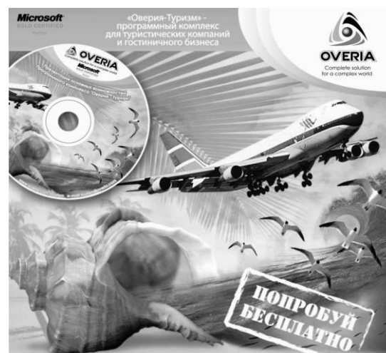
Рис. 1. Бренд программного комплекса «Оверия-Туризм» компании ООО «Оверия»