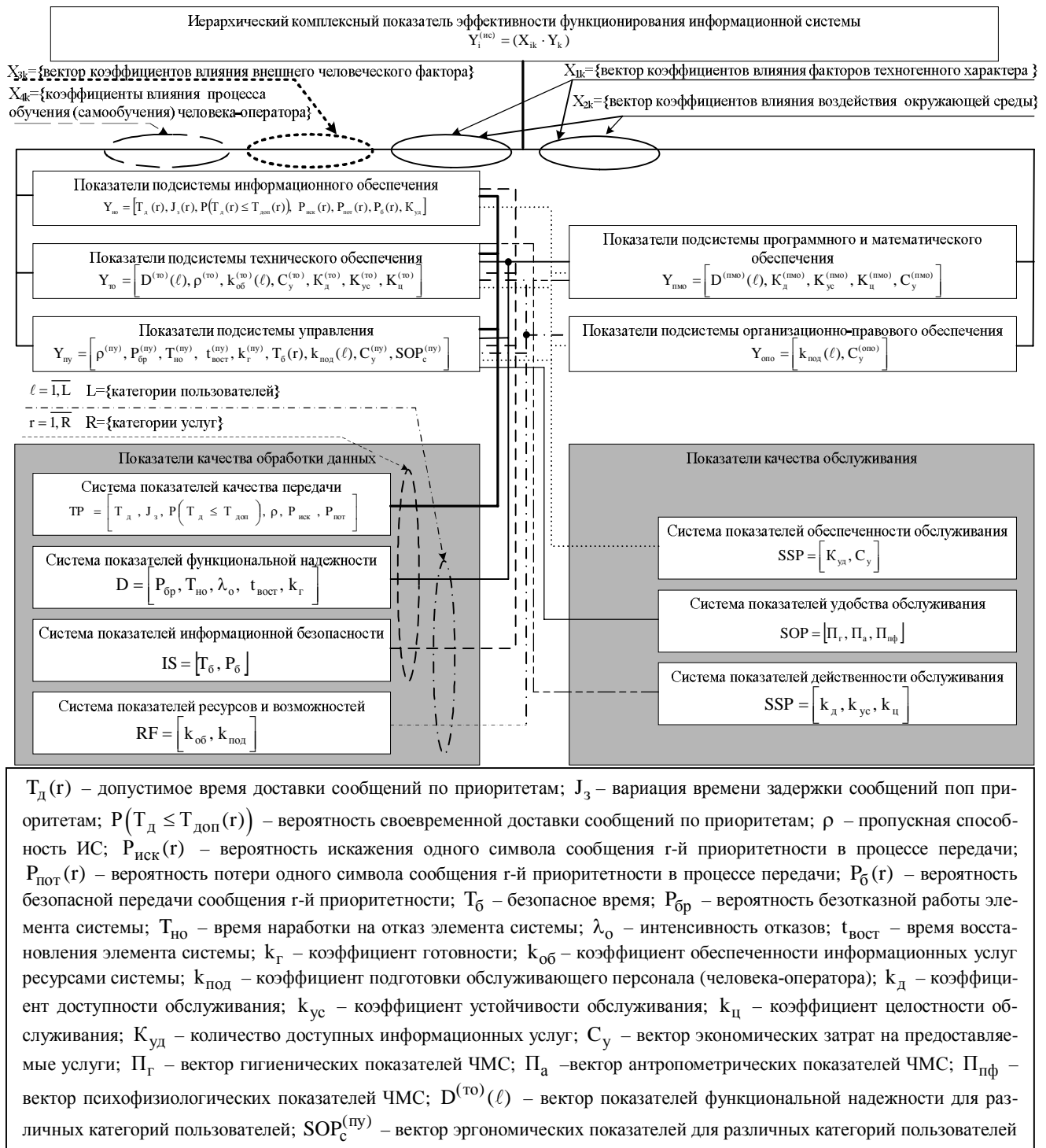
Рис. 2. Иерархическая векторная система показателей качества функционирования ИС

В результате перемножения (выражение 1) будет сформирована матрица, представляющая собой комплексный показатель эффективности функционирования ИС.