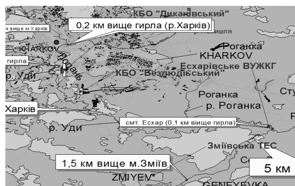
Рис. 3. ГІС-аналіз даних про об'єми скидання забруднених стоків в басейн річки Сіверський Донець підприємствами Харківської області