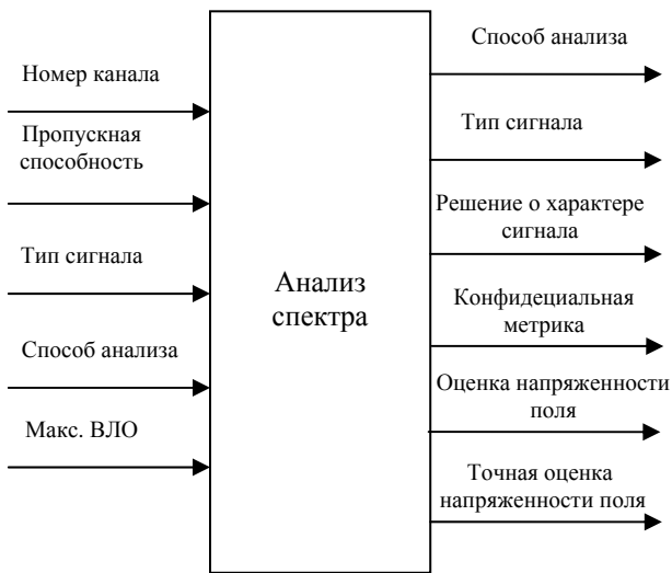
Рис. 2. Обобщенная структурная схема мониторинга спектра

Первые два входа, "Номер канала" и "Полоса пропускания канала", определяют, какой канал анализировать, а после – пропускную способность этого канала. Характеристики сигналов для анализа определяется входом "Тип сигнала". Типы сигналов включают различные аналоговые телевизионные сигналы (например, NTSC), цифровые телевизионные сигналы (например, ATSC), сигналы сотовых телефонов и т.д. Вход "Способ анализа" определяет один из способов для анализа спектра. Вход "Макс. ВЛО" определяет максимальную вероятность ложного обнаружения в случае наличия в канале только шума.