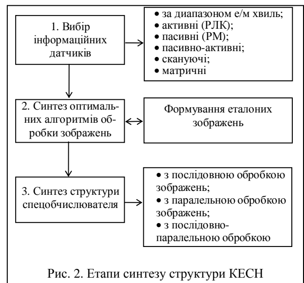
Рис. 2. Етапи синтезу структури КЕСН

На першому етапі проводиться вибір типу інформаційних датчиків, що задовольняє вимоги з точності наведення, всепогодності, швидкодії, заводо захищеності, габарито-масових характеристик, вартості.