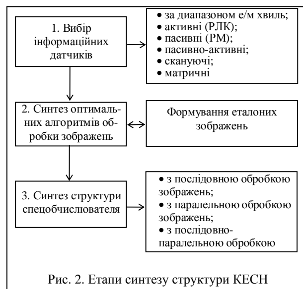
Рис. 2. Етапи синтезу структури КЕСН

На першому етапі проводиться вибір типу інформаційних датчиків, що задовольняє вимоги з точності наведення, всепогодності, швидкодії, заводо захищеності, габарито-масових характеристик, вартості.