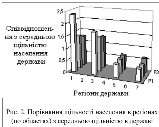
Рис. 2. Порівняння щільності населення в регіонах (по областях) з середньою щільністю в державі

Навіть без детального аналізу зрозуміло, що наявний бойовий потенціал ЗС України не здатний забезпечити створення ефективної оборони по усьому кордону держави і прикрити від нападу з повітря та суші важливі державні об'єкти на будь-якому з оперативних напрямків. Тому в регіоні дер-