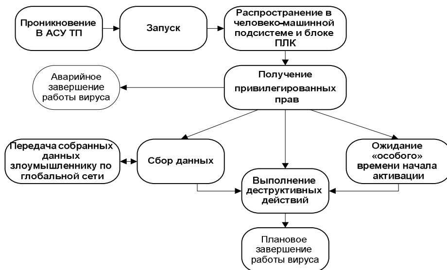
Рис. 2. Схема узагальненого алгоритму можливого поведіння злоумисленого програмного забезпечення (комп'ютерного вірусу) при атаці ОС QNX АСУ ТП