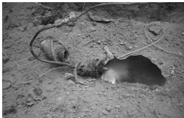
Рис. 1. Фото гидридных систем хранения водорода после их разрушения