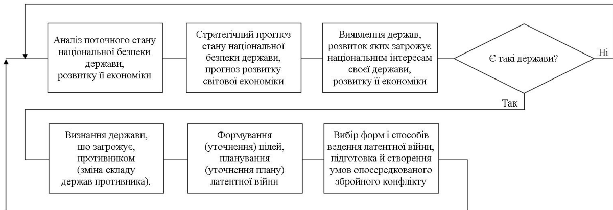
Рис. 3. Порядок визначення противника та обґрунтування необхідності, форм і способів ведення латентної війни

поділу й так обмежених ресурсів, що вимусить їх вибирати інший бік, яких у протистоянні лише два. Саме такі об'єктивні фактори у перспективі створюють умови формування біполярного світу.