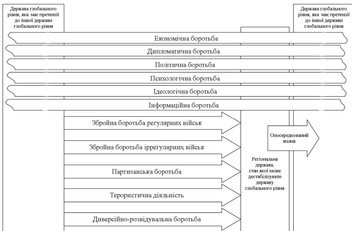
Рис. 2. Хід латентної війни з використанням опосередкованих конфліктів

цивілізаційного середовища з використанням всіх наявних сил та засобів, включаючи власні збройні сили, як інструменту досяжності політичної мети.