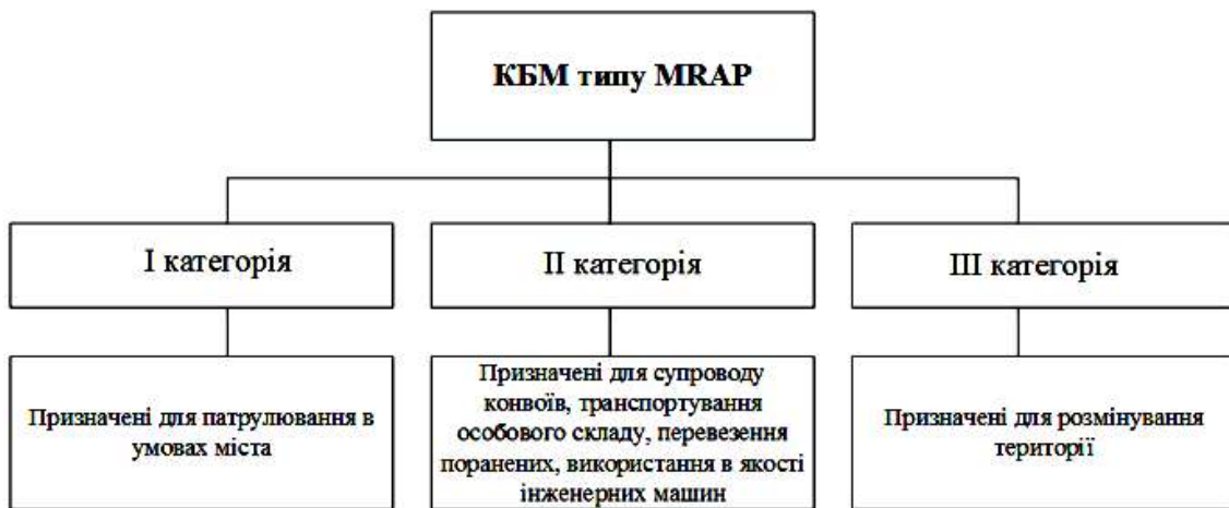
Рис. 2. Класифікація БММ типу MRA США

середні бронев автомобілі – автомобілі класу «Волк», до яких відносяться: ВПК-3927 «Волк» та бронев автомобіль «Горец-К» з відповідним доопрацюванням;