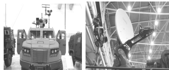
Рис. 3. Встановлення апаратури Тоoway на БРДМ