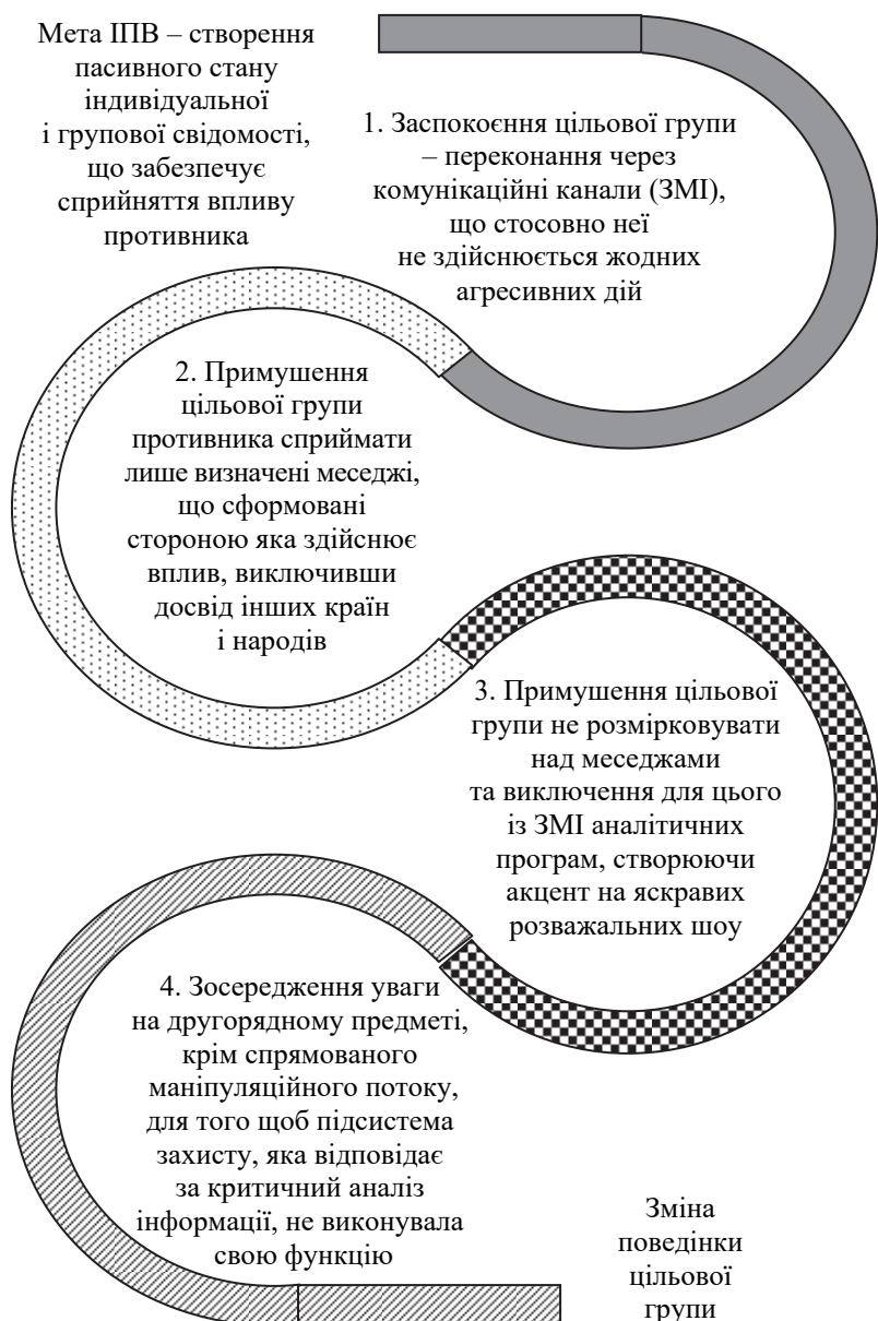
Рис. 2. Механізм інформаційно-психологічного впливу на цільову групу